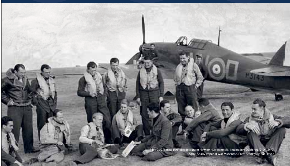
Dílo 310. perutě RAF před letounem Hawker Hurricane Mk I na letišti v Duxfordu (7. 9. 1940).

Věděli jste, že jeden z nich létal bez nohy? Že se důstojnický sluha stal velitelem britské perutě? Výstava mapuje období od počátku výcviku budoucích příslušníků RAF, přes jejich nebezpečné útoky do odboje i boje za svobodu v letectvech několika zemí.