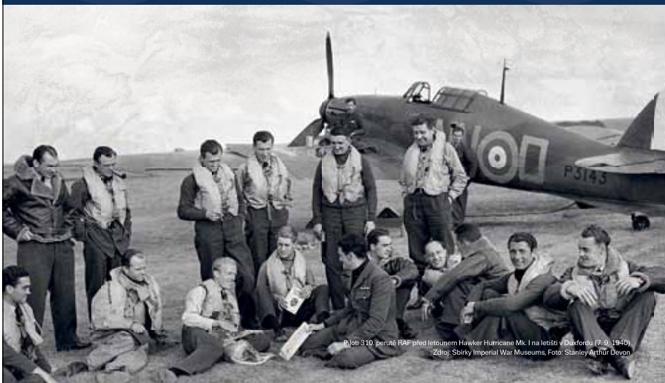
Djot 310. peruté RAF před letounem Hawker Hurricane Mk I na letišti v Duxfordu (7. 9. 1940).

Věděli jste, že jeden z nich létal bez nohy? Že se důstojnický sluha stal velitelem britské peruté? Výstava mapuje období od počátku výcviku budoucích příslušníků RAF, přes jejich nebezpečné útoky do odboje i boje za svobodu v letectvech několika zemí.