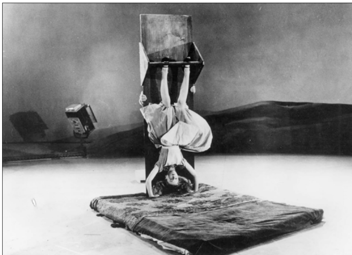
Svět naopak Alenky v říši divů v prvním Disneyho ztvárnění

O medijsa akor irinenas pal o Roma sar o zločinci, save pes nakamen te prispusobinel la čechikona nacjake, hoj hine banda, so pre lende e spoločnosť ča dopořinel, hoj cicinen avri o socijalno sistem. Ala stereotypos andre čechiko spoločnosť ekgzistinelas imar čirila, he but gore le Romen avka dikhen mek adadžives. Ada hin tiž dovodos, soske ehin maškar o gore he maškar o Roma ajso baro bibachtalipen. O Roma he o Čechi hine moneki dur ke peste, hjaba dživen andro jekh štatos. Angle ala predsudki hine o Roma andre peskro dživipen furtom diskriminimem he furtom peske pre lende roden vareso avri. Le Romen nane šanca te dživel ajso dživi-